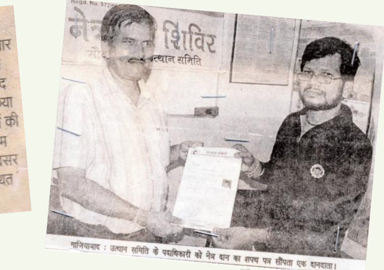
गाजियाबाद : उत्थान समिति के पदाधिकारी को नेत्र दान का शपथ पत्र सौंपता एक दानदाता।