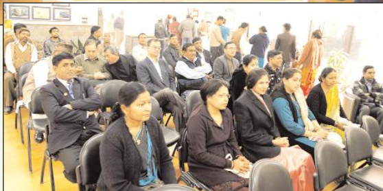
Health check-up camp organized with the help of Columbia Asia Hospital.